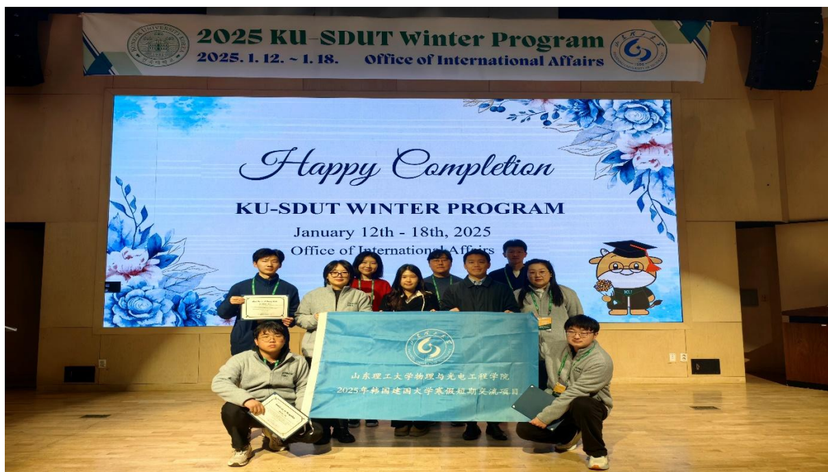
学院部分师生参加短期国际交流项目