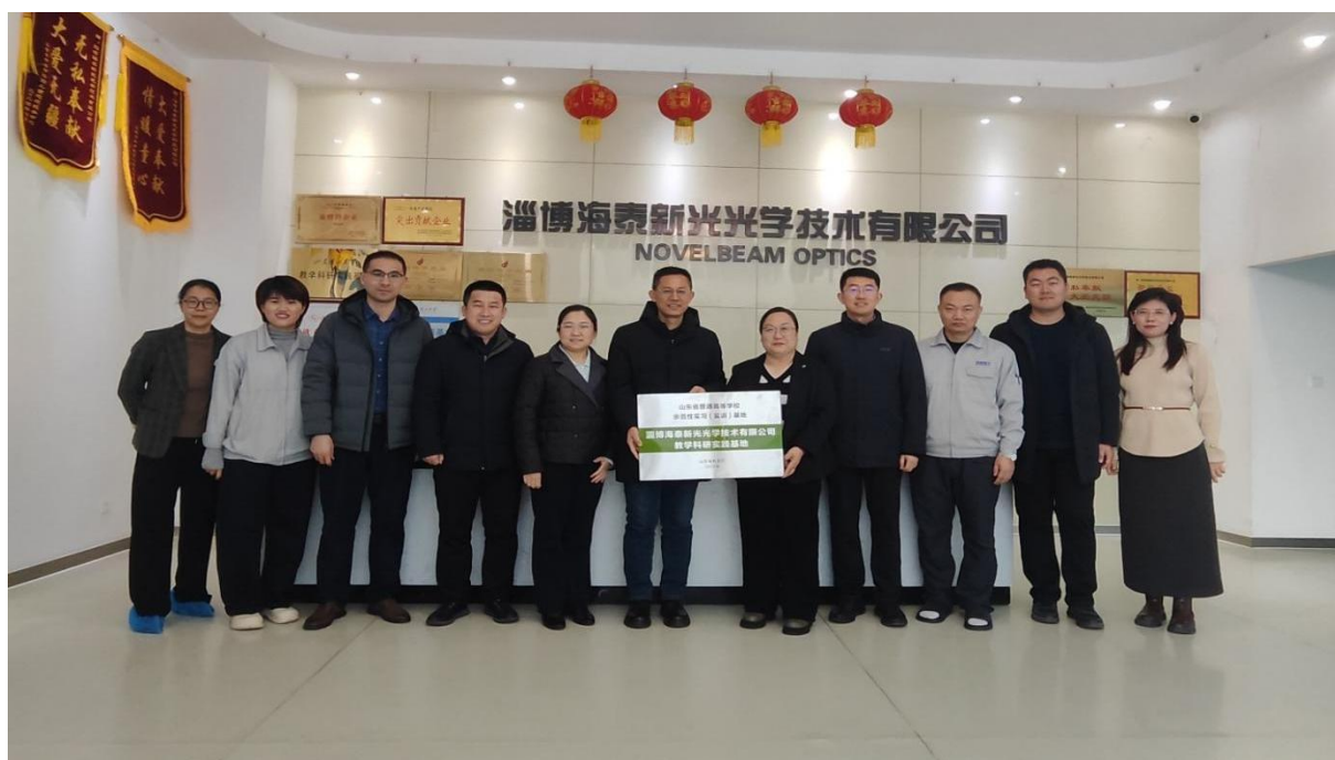
深化校企合作为省级高等学校示范性实习（实训）基地授牌