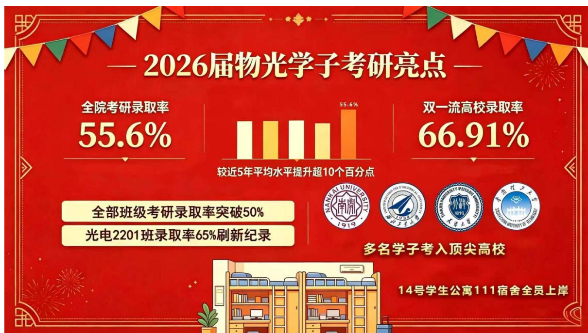
我院 2026 届毕业生考研录取率 55.6%